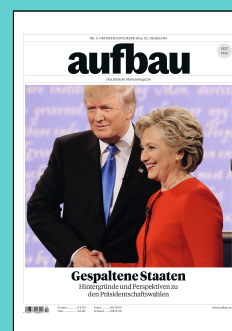
Titelseite: Oktober/November 2016