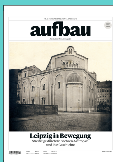
Titelseite: Februar/März 2017