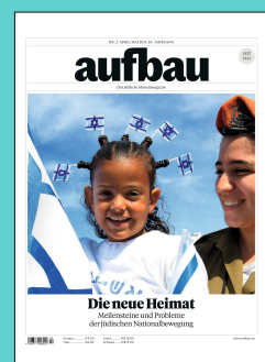
Titelseite: April/Mai 2017