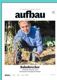
Titelseite: Dezember 2016/Januar 2017

Since 2005, aufbau is published as a special issues and authors' magazine in an attractive and contemporary format. aufbau is relevant. It takes the time to competently explore issues from all angles and to look beyond headlines. aufbau thus also serves as a bridge which helps to point the way from the Holocaust generation to the future of European Jewry. aufbau is written and intended for readership which defines itself not just by their interest in Judaism, but as an active part of society as a whole. It is also written for readers who – in these times of upheaval – wish to read a contemporary publication which offers orientation, presents deep background information and helps its readers form an independent opinion. Thus aufbau addresses the demographics which you target for your services and products.