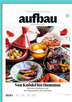
Titelseite: August/September 2016